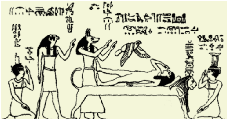
Eine Löwencouchszene. Ähnlich, wie sie auf den Joseph-Smith-Papyri gefunden wird. Osiris Hemka, der mit Isis, die in Form eines Falken über ihm schwebt, einen Sohn zeugt. Anubis, Horus, Nephtys und Shentit sind anwesend. (Mariette, Dendara , IV, 90)

Wie bereits erwähnt, sind diese Zeichnungen keine Seltenheit. Das folgende Bild zeigt eine ganz ähnliche Szenerie: